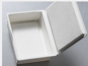
ヒンジ折り形状も可能