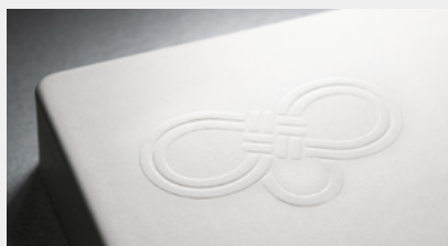
目を引くエンボス