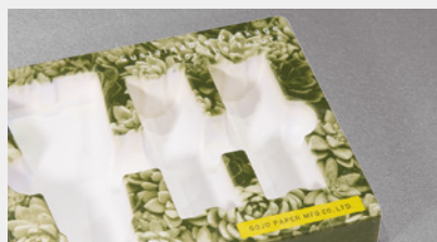
インクジェット/パッド印刷

※モールド形状や絵柄によってはご希望の形状・印刷・加工ができない場合もございます。