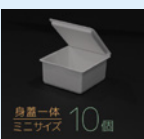
身蓋一体 ミニサイズ 10個