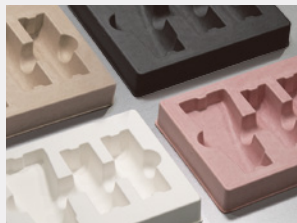
オーダーカラーに対応