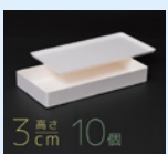
3cm 高さ 10個