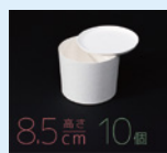
8.5cm 高さ 10個

豊富な一般規格品ラインナップにより、金型代不要で初期コストを抑えた導入が可能です。身蓋セパレートタイプはレギュラー・ハーフ・ワイド・円筒など用途に合わせた形状を豊富に展開。ヒンジ入りの身蓋一体タイプにはカードサイズ・ミニサイズをご用意しています。まずはお気軽にお問い合わせください。