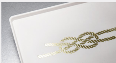
キラリと光る箔押し

一般の紙と同様に優れた加工適性を備えています。 下記の加飾加工に加え、抗菌・耐油・防黴(ぼうばい)といった機能を加える加工にも対応可能です。