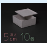
5cm 高さ 10個