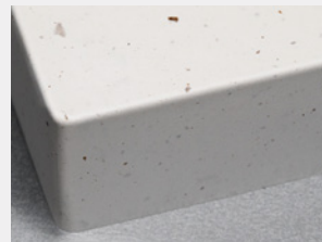
素材の混抄が可能